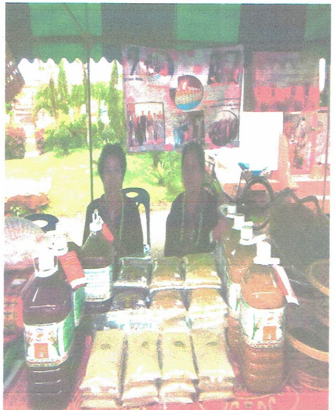
การจัดจำหน่ายสินค้า OTOP ของกลุ่มแม่บ้าน