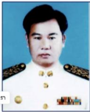
ติดต่อเรา

E-Mail ทต.วาริชภูมิ จ.สกลนคร saraban@waritphom.go.th